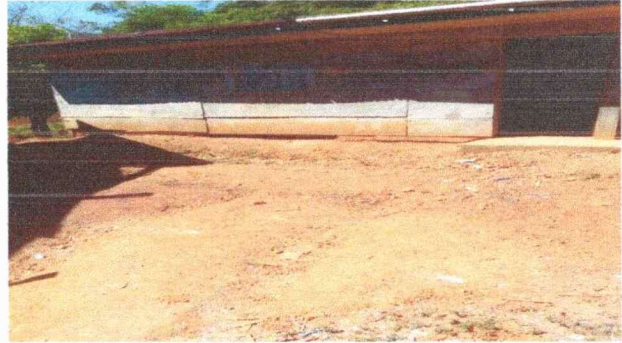
Foto 2: Se observa la necesidad de que no cuenta con un buen techo.