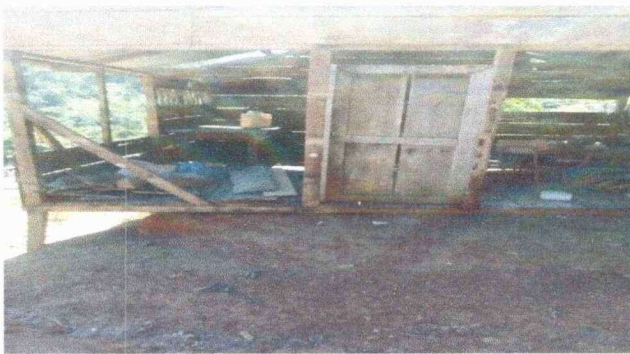
Foto 3. Necesidad de cambio de techo.